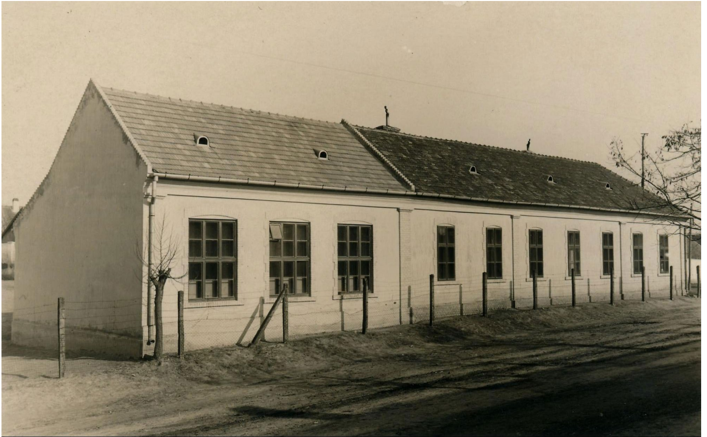
fotografia z roku 1932, autor neznámy