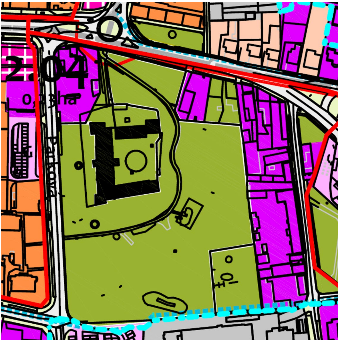
výrez z výkresu Komplexný urbanistický návrh, Územný plán mesta Galanta, čístopis 12/2021