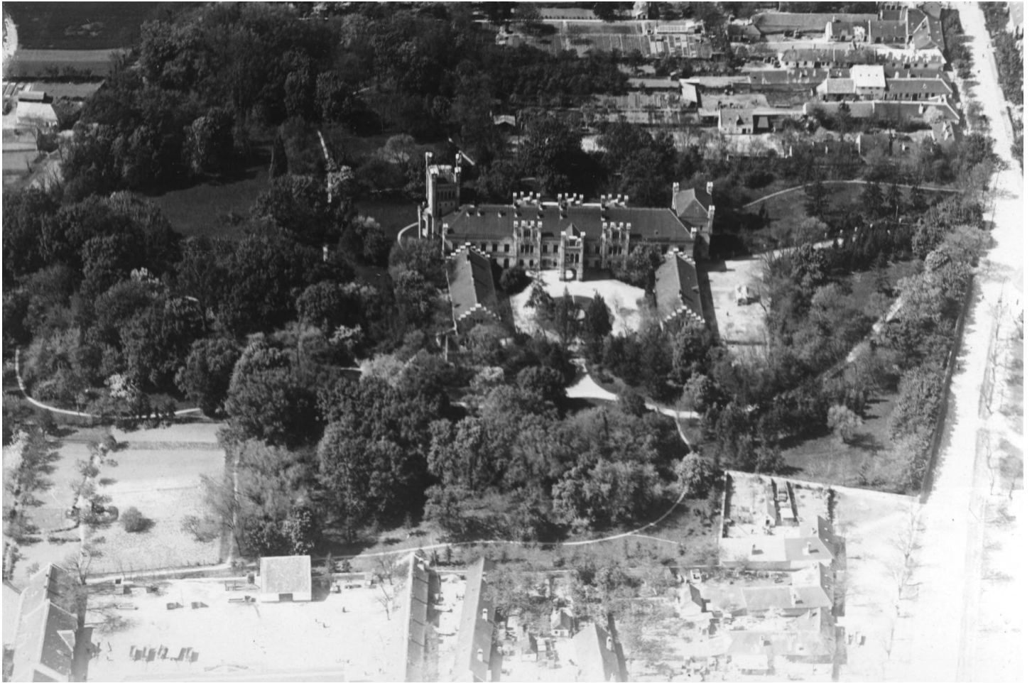
fotografia cca z roku 1928, autor pravdepodobne J. Štefl

K dnešnému dňu nebol zistený nijaký zachovaný prameň s konkrétnou informáciou o tom, akému účelu hospodárskeho vybavenia slúžili objekty v areáli riešeného územia v 19. storočí, avšak je pravdepodobné, že sa jednalo o hospodárske zázemie kaštieľa.