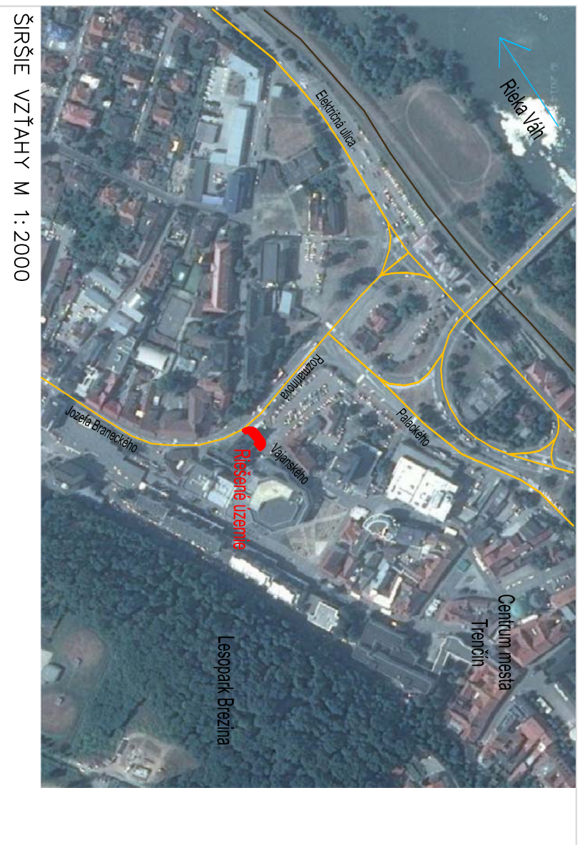
ŠIRŠIE VZŤAHY M 1:2000