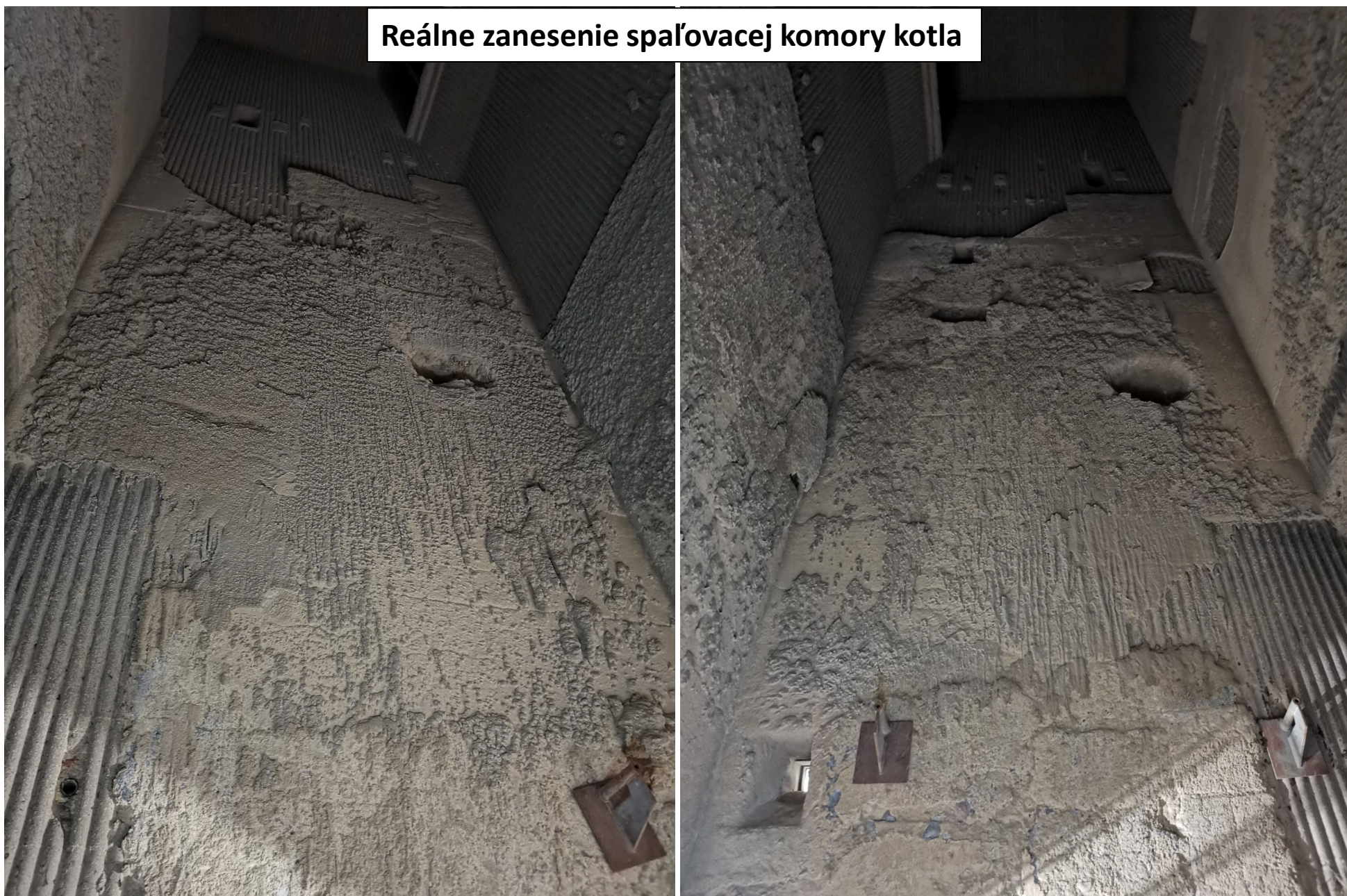
Reálne zanesenie spaľovacej komory kotla