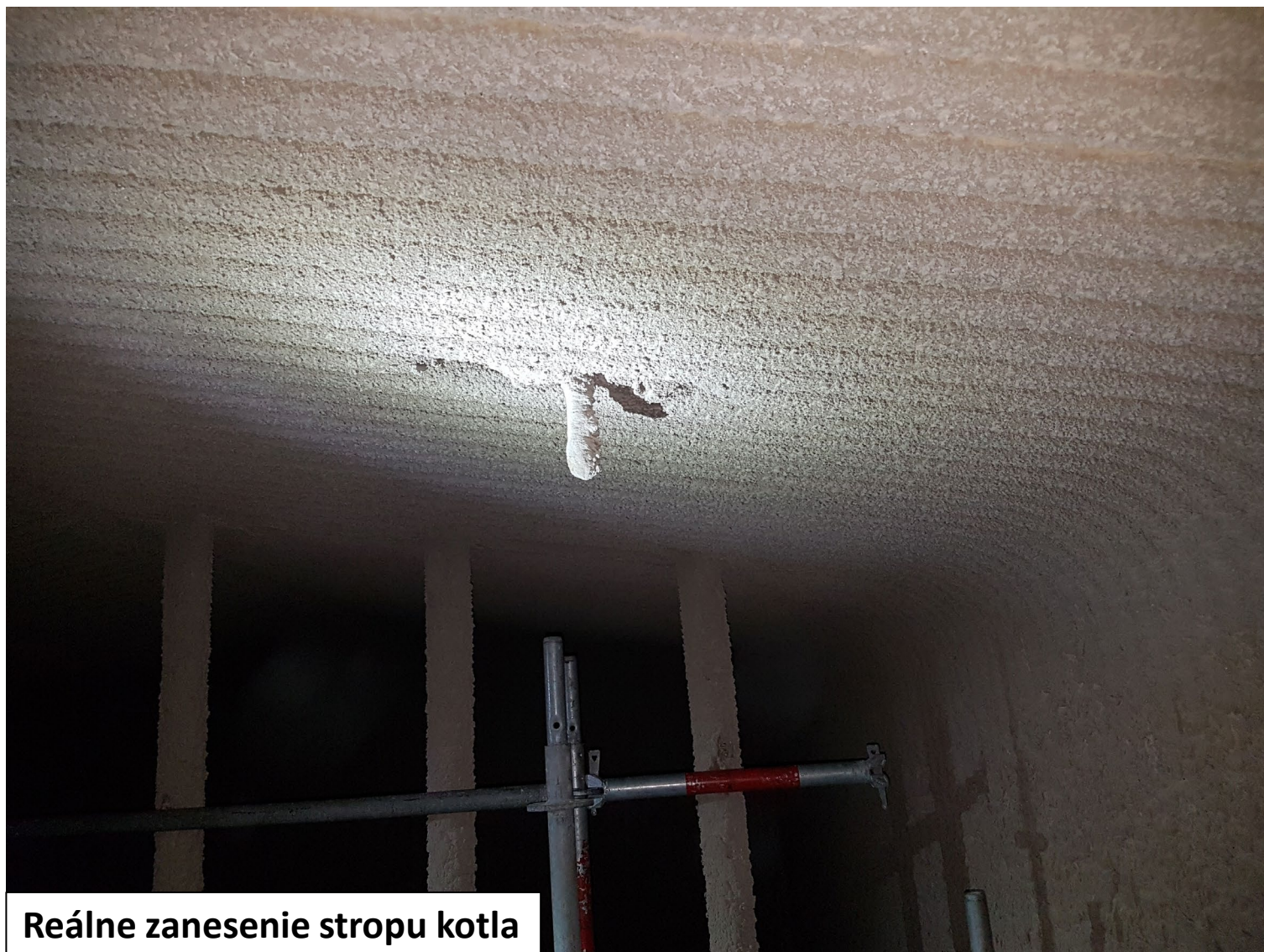
Reálne zanesenie stropu kotla