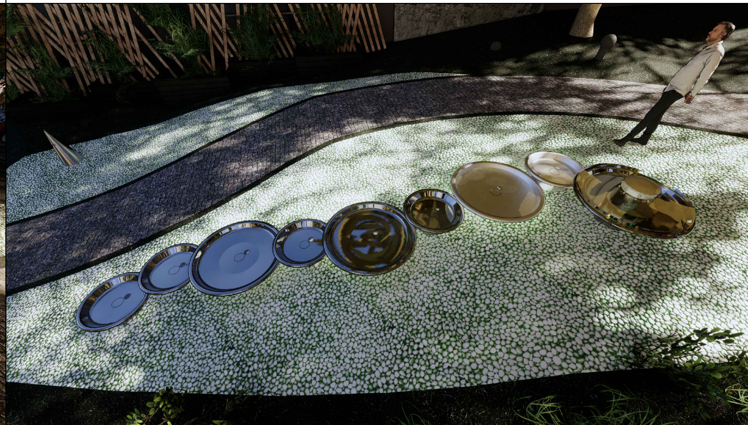
Vizualizácia vodných prvkov 2.