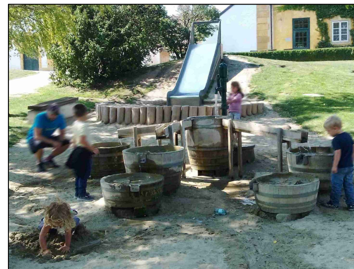
Príklad riešenia vodných prvkov formou drevených nádob Vodné ihrisko zámok-Schloss-hoff-Rakúsko