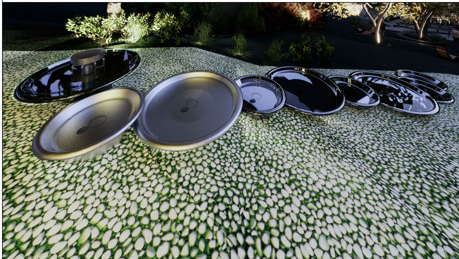
Vizualizácia vodných prvkov 3.

Realizačný projekt nenahrádza dielenskú dokumentáciu. Vybraný dodávateľ stavby bude povinný pred realizáciou vypracovať dielenskú dokumentáciu, ktorá musí byť konzultovaná a schválená autormi návrhu a investorom.