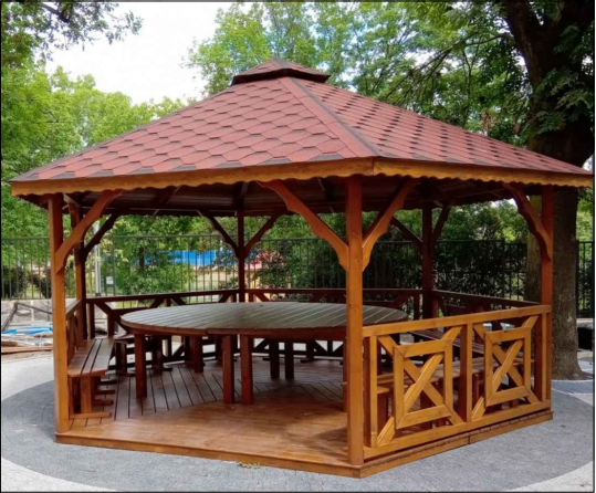
Drevený altánok na mieste pôvodného zastaralého posedenia