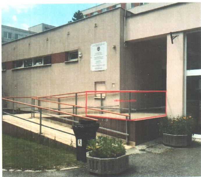
Obr. č. 1 Predný vchod

dĺžka cca 4 000 mm, výška 900 mm, zvyšné zábradlie s vodiacimi tyčami