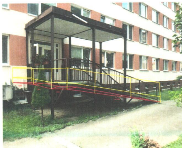
Obr. č. 3 Bočný vchod časť D

Na existujúci otvor sa musí urobiť zábradlie, dĺžka cca 1 200 mm, výška 900 mm