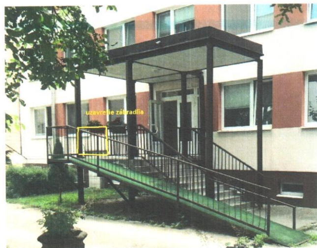
Obr. č. 4 Uzavretie zábradlia