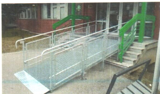
Obr. č. 2 Výplň zábradlia