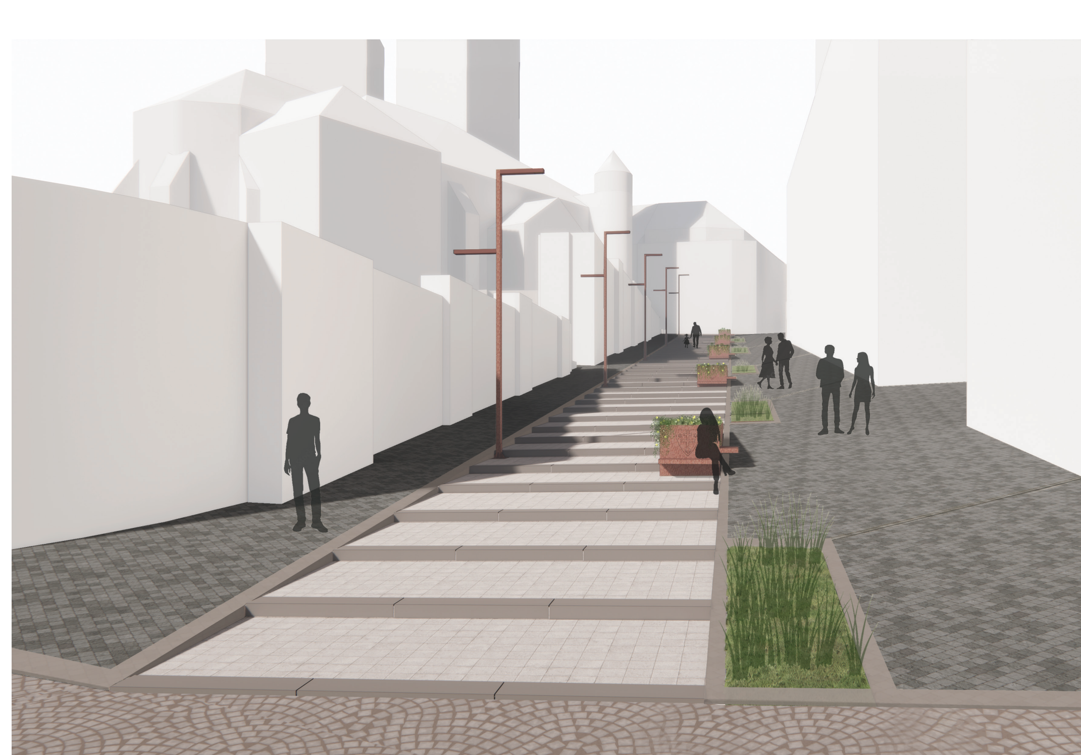
FARSKÉ SCHODY • VIZUALIZÁCIA Z NÁMESTIA