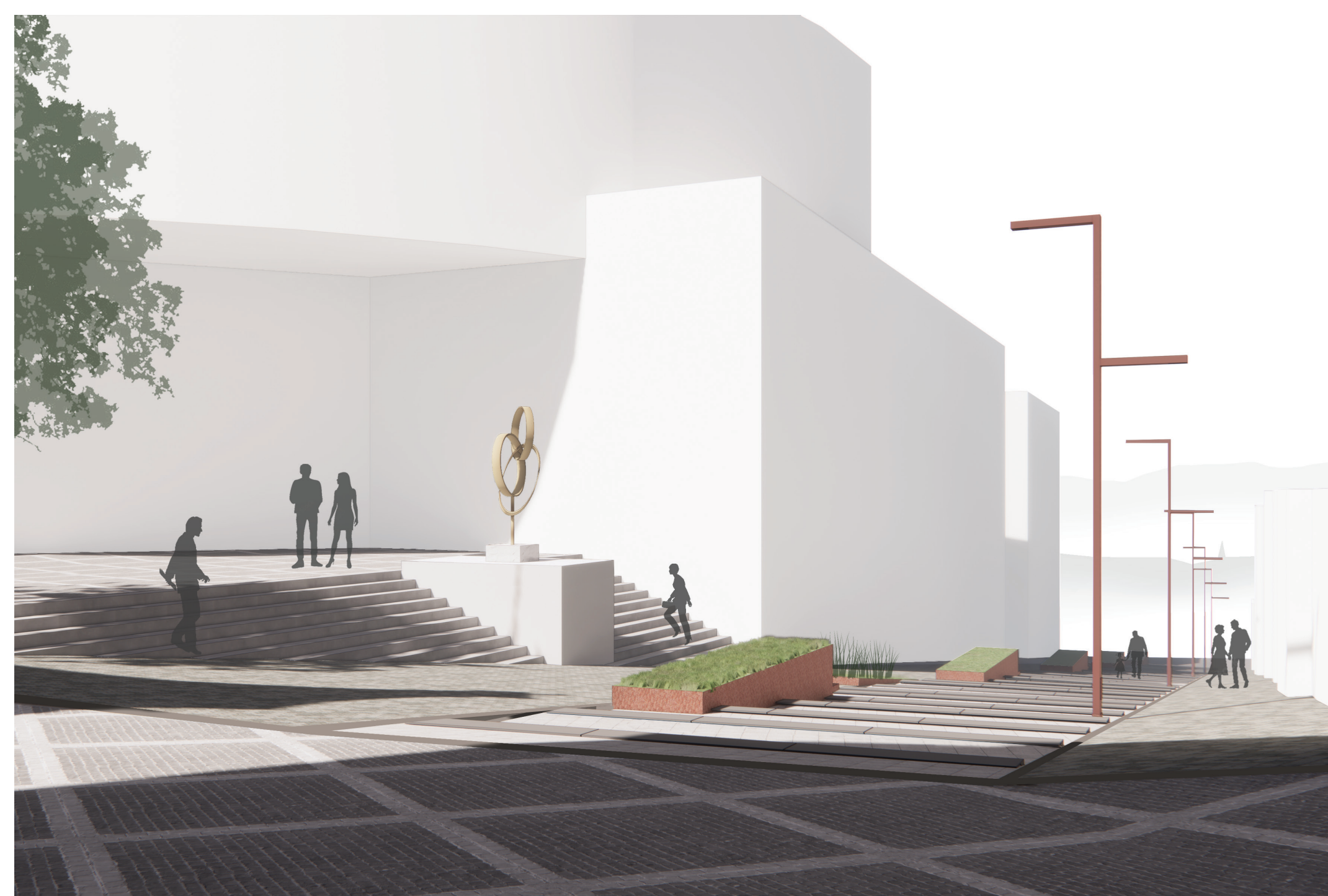
FARSKÉ SCHODY • VIZUALIZÁCIA Z FARSKÉJ ULICE