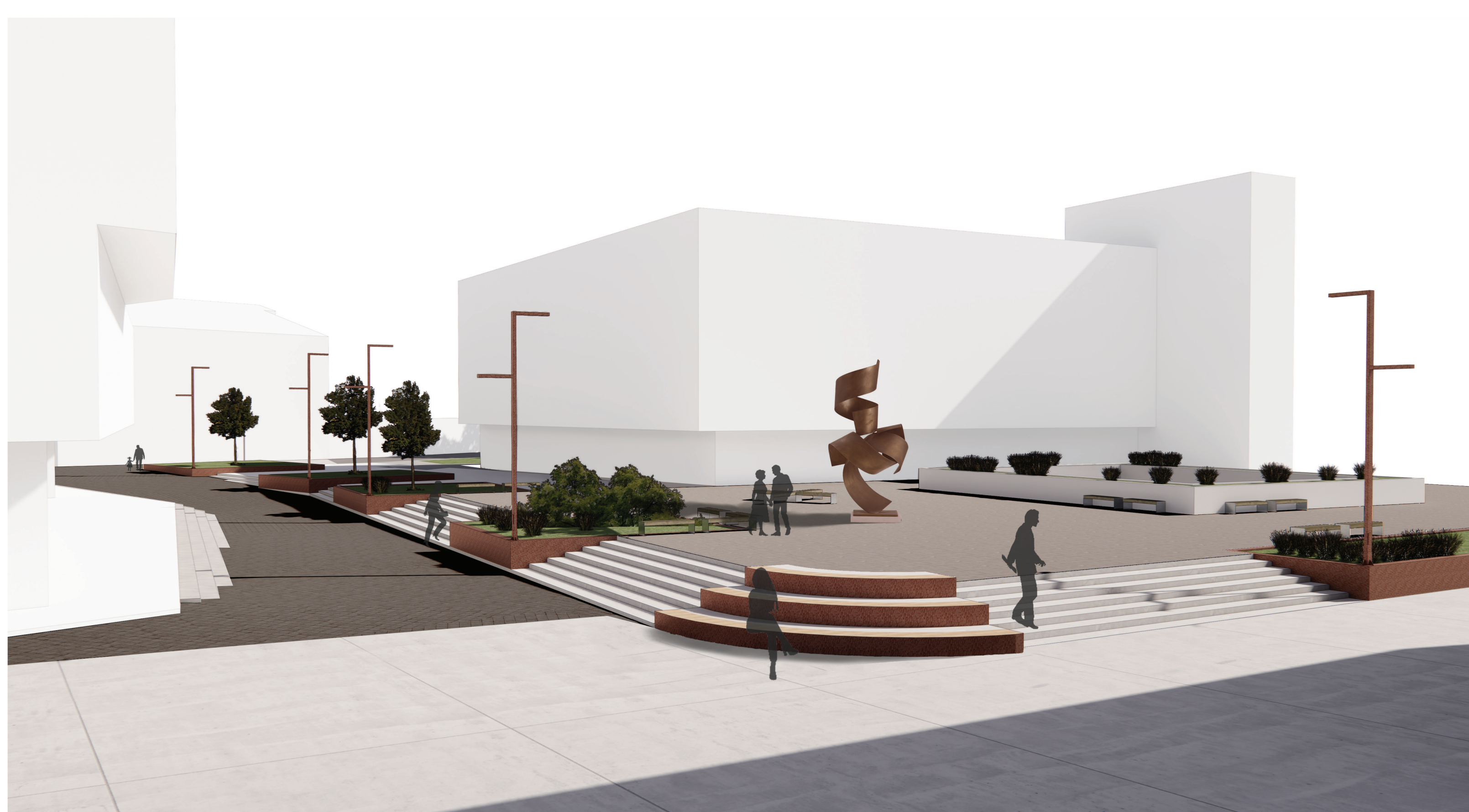
NA BRÁNE • VIZUALIZÁCIA PRIESTRANSTIEV