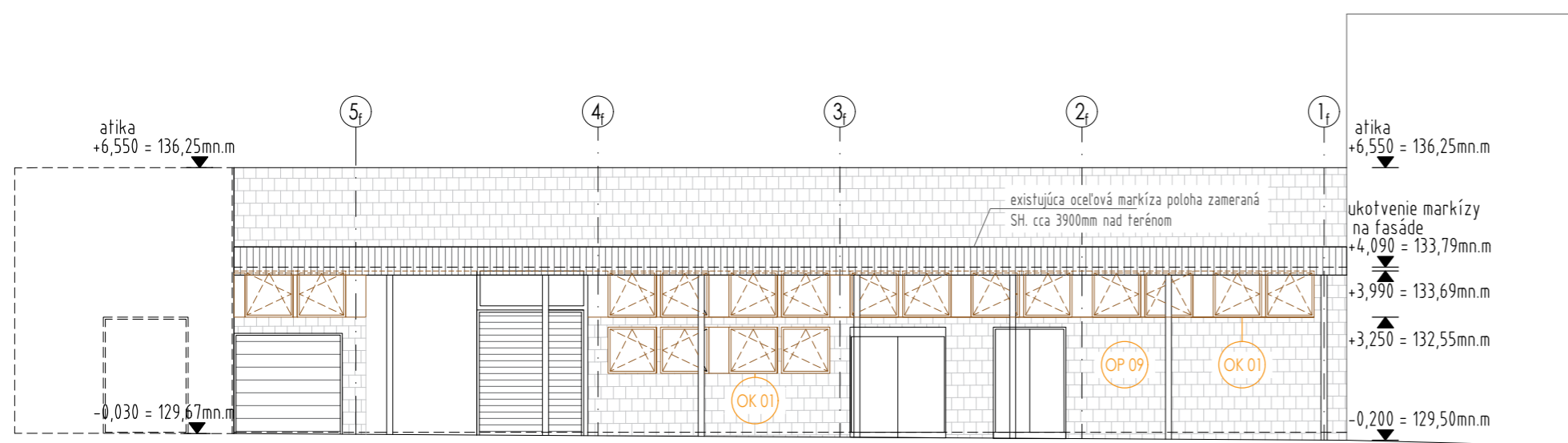
POHLÁD NA FLÁŠKÁREŇ JUHOZÁPADNÝ (DVORNÝ)