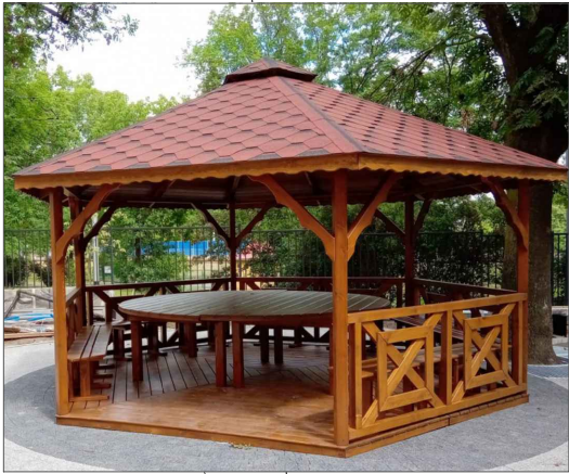
6 - uhoľníkový altánok s priemerom 5m drevená podlaha, stôl a lavice