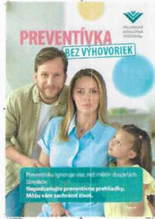
Položka č. 2 – Plagát A3