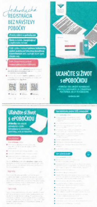
Položka č. 8 – Leták DL – 1 lom