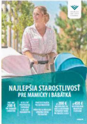
Položka č. 1 – Plagát A1