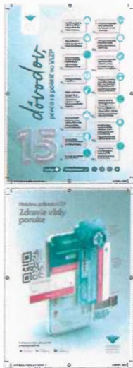
Položka č. 4 – Leták A5