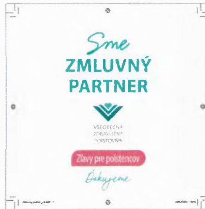
Položka č. 13 – Nálepka 15x15cm