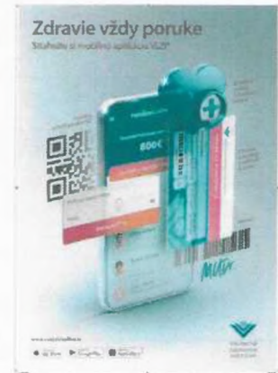
Položka č. 3 – Plagát B1