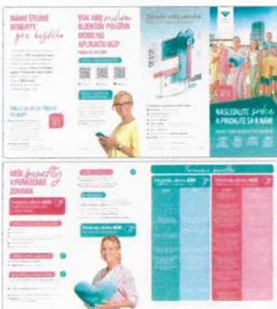
Položka č. 6 – Leták DL – 3 lomy