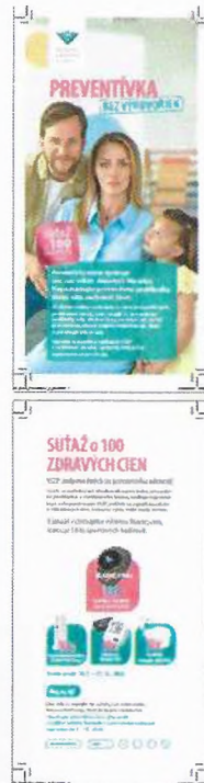
Položka č. 9 – Leták DL – bez lomu