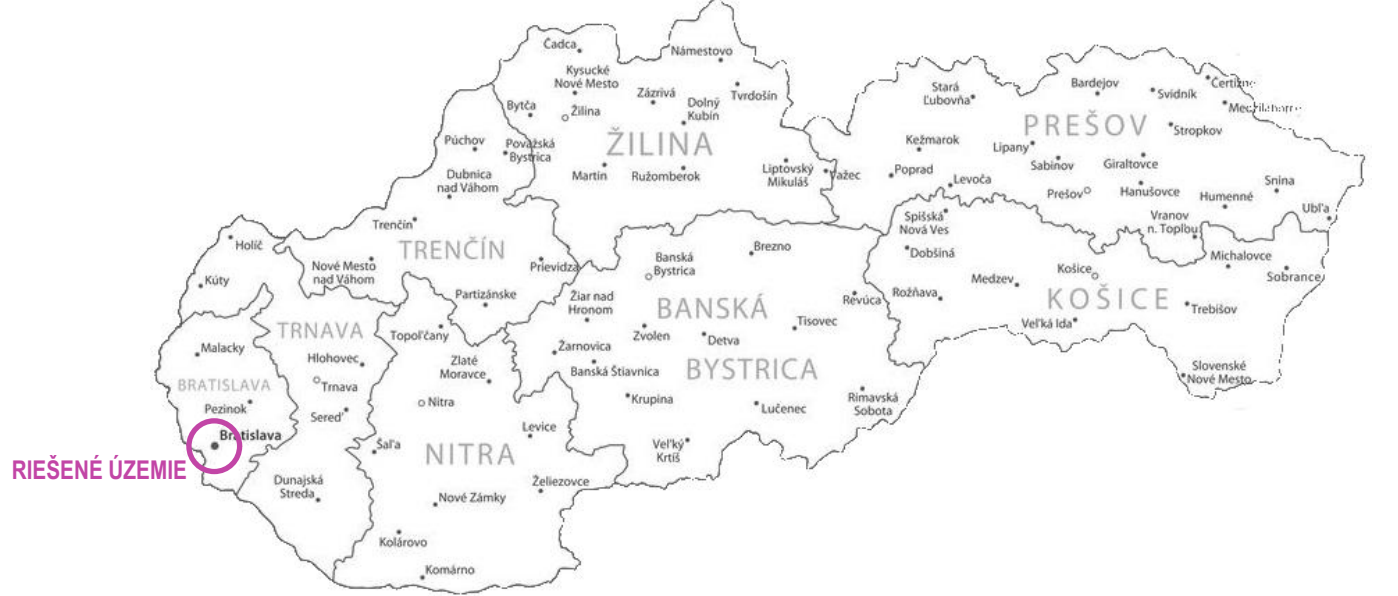
MAPA SLOVENSKEJ REPUBLIKY

LEGENDA: Riešené územie Existujúce okolité objekty