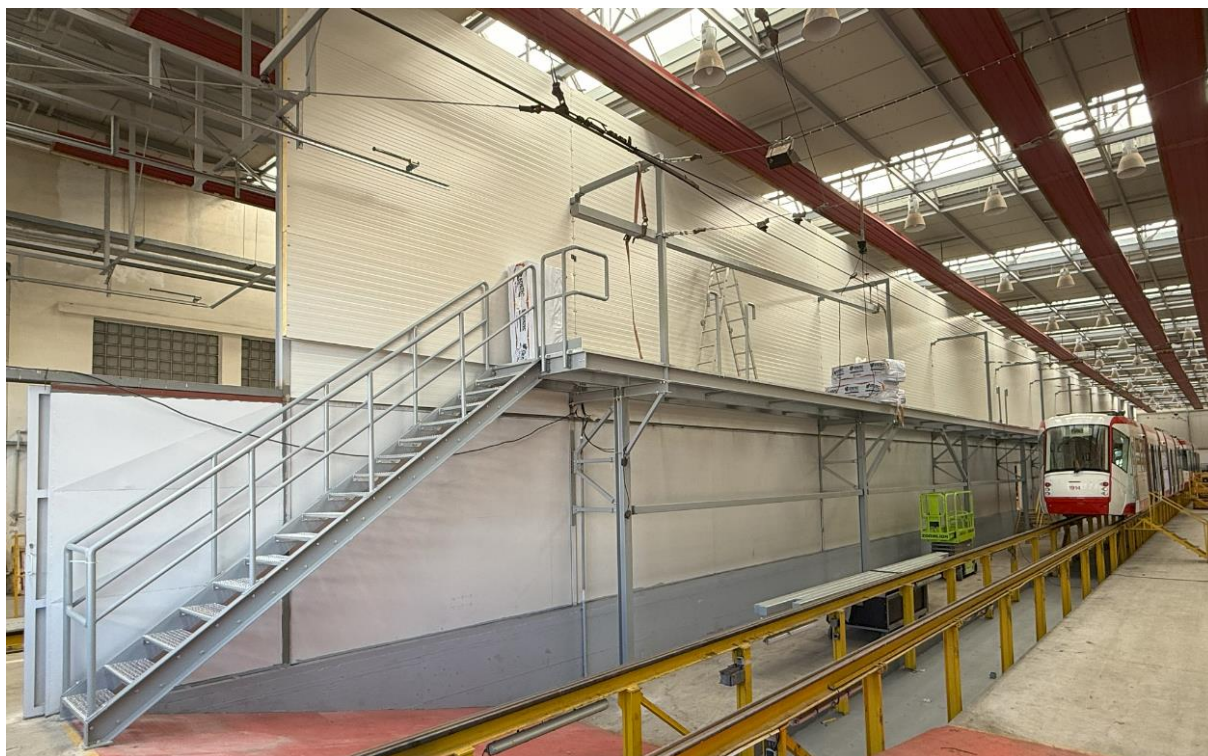
Obrázek 3 - Fotografie nové lávky v průběhu montážních prací (zde bude instalován kolejnicový záchytný systém) - stav k 18.3.2025