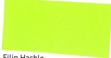
Filip Hachle konateľ spoločnosti