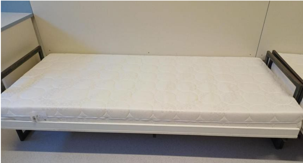
Ilustračná fotografia matraca na posteli