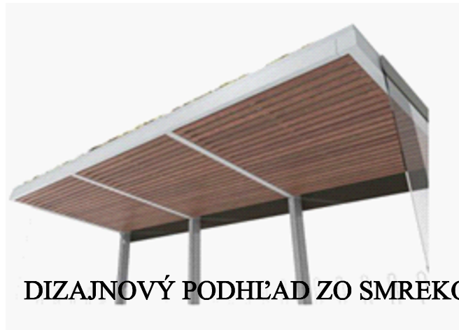
DIZAJNOVÝ PODHĽAD ZO SMREKOVCA