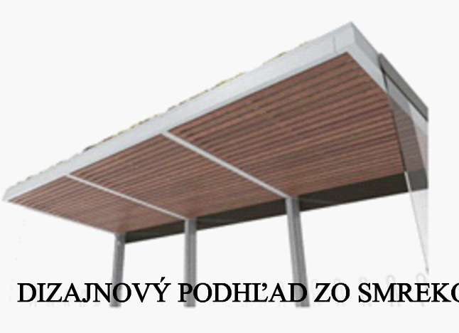
DIZAJNOVÝ PODHĽAD ZO SMREKOVCA